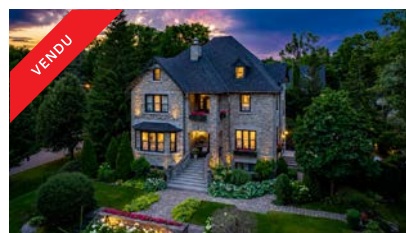
922 Grande-Allée O., Québec Représentant les acheteurs