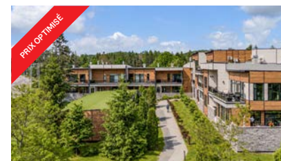
1001-101 Boulevard. Du Lac, Lac-Beauport 1,150,000$