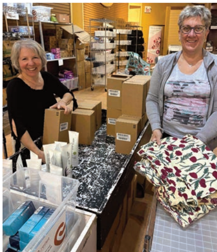
Les bénévoles de l'organisme en action.

Pour faire un don et soutenir la mission essentielle de l'organisme : lerefletorganisme.ca