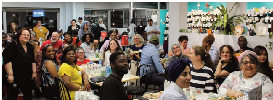
Le 16 mai dernier, à l'occasion de la Journée internationale du vivre-ensemble en paix, près de 70 résidents de Sainte-Foy provenant de plus de 18 nations différentes se sont réunis au Crackpot Café pour participer à Paroles et partage.

Paroles et partage a été organisé en collaboration avec le Cercle de fermières de Sainte-Geneviève-de-Sainte-Foy, le Centre culturel islamique de Québec, la Casa Latino-Américaine de Québec, l'Association haïtienne de Québec et le Crackpot Café, grâce au soutien financier de la Ville de Québec et du ministère de l'Immigration, de la Francisation et de l'Intégration (MIFI). ●