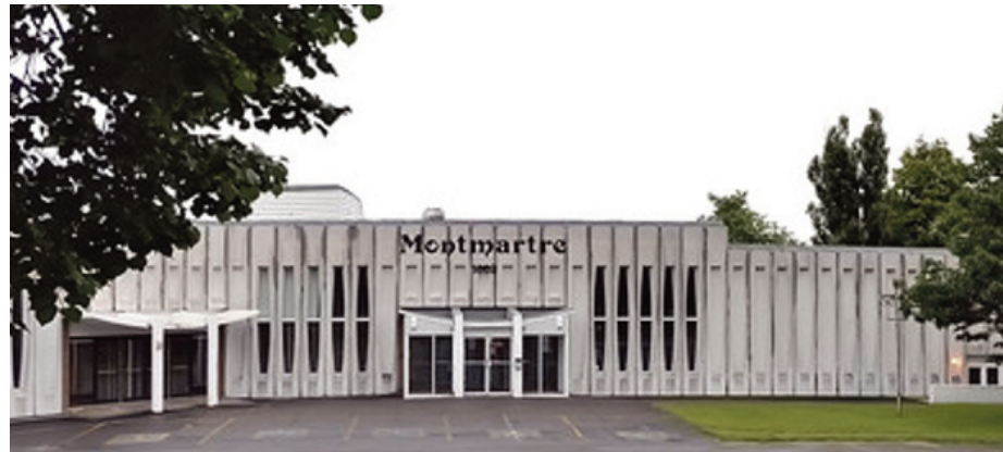
Vue de face du Montmartre à Sillery •