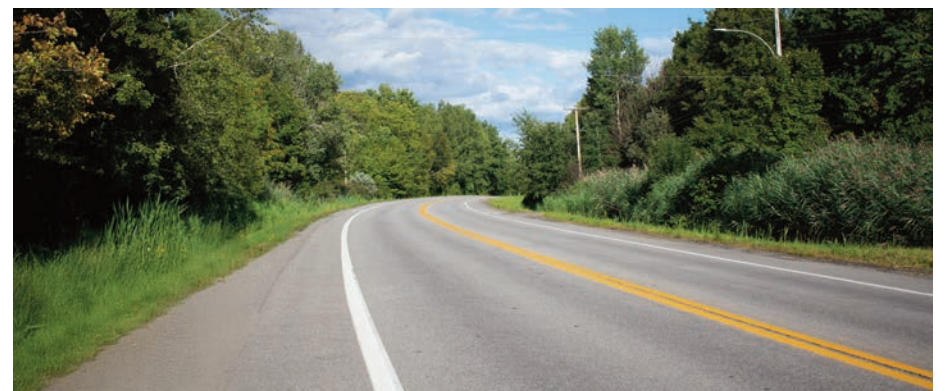
Le maire, Sylvain Juneau, affirme que Saint-Augustin-de-Desmaures récolte aujourd'hui les bénéfices d'une approche axée sur l'entretien préventif et les interventions réalisées avant que les infrastructures n'atteignent un état critique.

Pour les membres du conseil municipal, les résultats observés ce printemps viennent confirmer qu'une stratégie axée sur l'entretien et la prévention produit des effets tangibles, tant techniques que financiers. Le maintien des infrastructures constitue l'une des priorités du conseil municipal et les investissements en ce sens se poursuivront. « Une rue en bon état ne fait pas les manchettes. On n'inaugure pas une réparation préventive ni une intervention d'entretien. Pourtant, ce sont ces gestes qui améliorent le plus directement la qualité de vie des citoyens. À Saint-Augustin-de-Desmaures, élus et administrateurs croient en une approche fort simple: moins de discours, moins de philosophie, plus d'ouvrage et plus de résultats. La base », conclut le Maire Juneau. ●