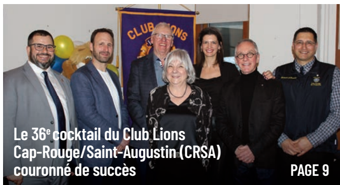
Le 36 e cocktail du Club Lions Cap-Rouge/Saint-Augustin (CRSA) couronné de succès PAGE 9