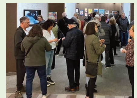
Des visiteurs lors du vernissage de l'an dernier.

L'exposition se déroulera au local RC-26 du Centre communautaire de la Pointe-de-Sainte-Foy, situé au 965, rue Valentin. Heures d'ouverture : jeudi 28 mai : de 11 h à 20 h, et du 29 mai au 4 juin : de 11 h à 18 h. ●