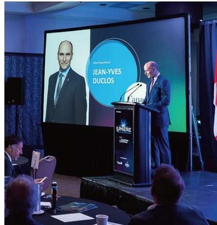
Étaient également présents des représentants de l'industrie, notamment ABB, EXFO et LumIR Lasers, réunis dans un panel consacré aux perspectives de croissance du secteur.

Le lancement de Vision 2035 s'appuie sur une mise à jour économique du secteur, qui compte plus de 270 entreprises au Québec, près de 25 000 emplois et une forte concentration dans les régions de Montréal et de Québec. L'industrie, déjà bien positionnée dans les domaines de la défense, de l'aérospatiale, des télécommunications et des sciences de la vie, est appelée à