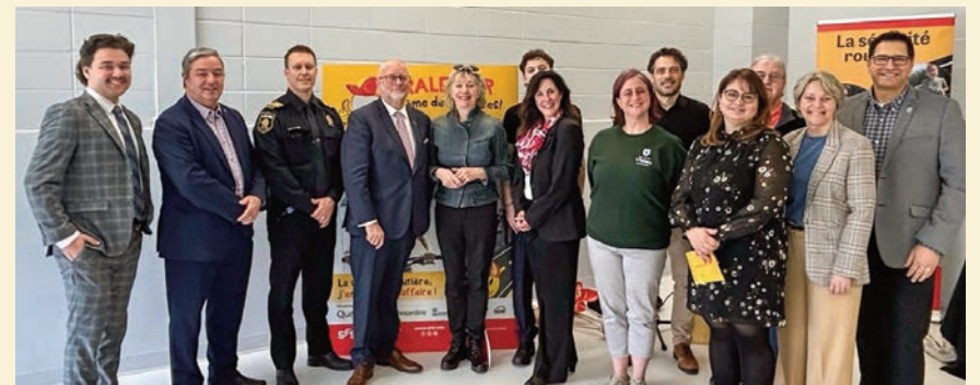
L'événement réunissait un très grand nombre de représentants de l'organisme, de politiciens, de représentants en sécurité routière et de partenaires.

« RALENTIR sème des sourires » devient la thématique de la campagne saisonnière mobilisatrice de SFSR. Le printemps marque une augmentation significative des déplacements actifs : marche, vélo, trottinettes et jeux extérieurs entraînant une cohabitation accrue entre piétons, cyclistes et automobilistes. Voilà pourquoi un exercice de sensibilisation s'imposait. ●