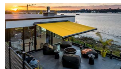
4232 Rue Saint-Laurent, Lévis Vue Panoramique au Fleuve • 1,575,000$