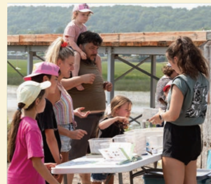
L'événement représente une belle occasion de faire un pique-nique en famille.

Lors de ces journées thématiques, le mouvement artistique de Cap-Rouge va réaliser des activités artistiques et le