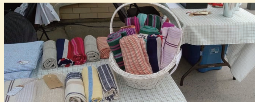
Plusieurs membres seront sur place pour vous offrir différentes pièces qu'elles ont créées (tissage, tricot, crochet et autres).

Plusieurs membres seront sur place pour vous offrir différentes pièces qu'elles ont créées (tissage, tricot, crochet et autres). Vous pourrez vous procurer des objets artisanaux faits à la main par leurs membres. Une belle occasion pour vous gâter ou faire de beaux cadeaux à vos familles et amis. ●