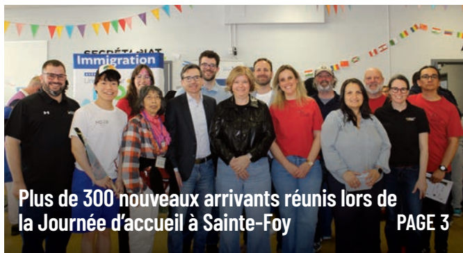
Plus de 300 nouveaux arrivants réunis lors de la Journée d'accueil à Sainte-Foy PAGE 3