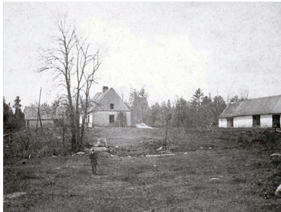
MAISON ROBITAILLE bâtie vers 1830 par Pierre Robitaille (5e gén.) située sur le lot 522 à Champigny et démolie vers 1898.

Le monument d'hommage aux familles Robitaille a été officiellement inauguré le 21 août 1993, en présence de nombreux dignitaires lors d'un grand rassemblement initié par l'Association, avec la participation