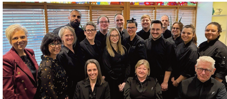
Quarante ans après avoir marqué la scène gastronomique en s'établissant hors du Vieux Québec, La Fenouillère amorce un nouveau chapitre porté par un leadership féminin fort.

Une nouvelle identité et des transformations plus importantes seront dévoilées à l'automne, marquant officiellement l'ouverture d'un nouveau chapitre pour le restaurant. Cette vision s'inscrit également dans le dynamisme du secteur de la tête des ponts, un quartier en pleine évolution. À travers ses initiatives, Nadeau Groupe Hôtelier, nouvellement propriétaire du restaurant depuis l'automne dernier, continue de contribuer activement à la vitalité de ce pôle stratégique, en sachant évoluer au rythme des tendances et des attentes de sa clientèle.