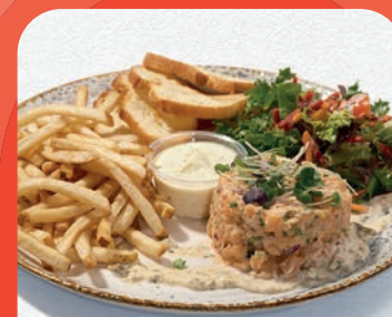
Tartare de saumon