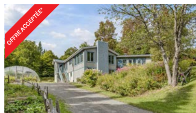
372 Ch. Du Moulin, Stoneham Domaine forestier • 2,600,000 Pi²