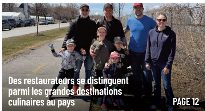
Des restaurateurs se distinguent parmi les grandes destinations culinaires au pays PAGE 12