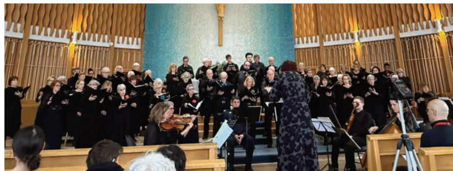
Plus de 60 choristes et instrumentistes ont offert un programme inspiré du printemps allant de la Renaissance à la musique romantique