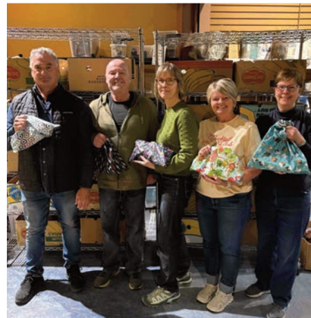
Encore cette année, grâce à la générosité de précieux partenaires et donateurs, les bénévoles engagés de l'organisme Le Reflet ont préparé avec soin des sacs-cadeaux composés de produits d'hygiène corporelle et de cosmétiques de qualité.