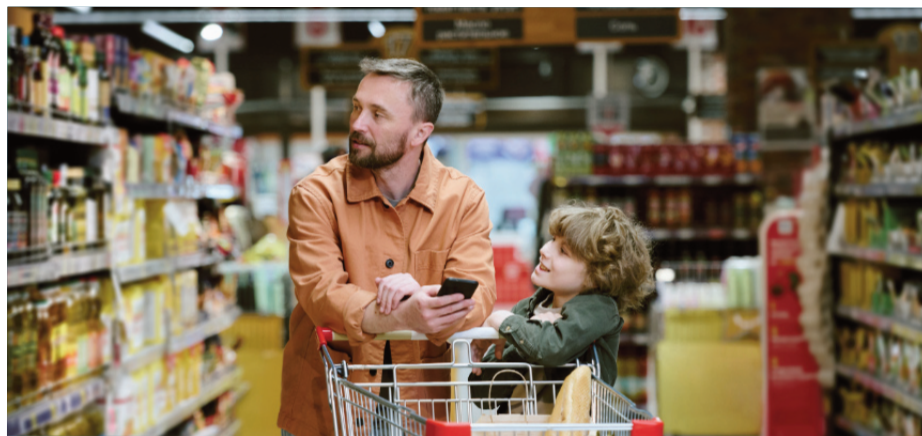
Cette année, une personne seule pourra recevoir jusqu'à 950 $, tandis qu'une famille de quatre pourra obtenir jusqu'à 1 890 $, afin d'aider à couvrir les dépenses courantes, notamment l'épicerie et les besoins essentiels.

Le programme prévoit également une augmentation de 25 % des versements trimestriels dès le 3 juillet, pour les cinq prochaines années. Plus de 12 millions de personnes au pays devraient bénéficier de cette nouvelle allocation, qui remplace et bonifie l'ancien crédit pour la TPS. » ●