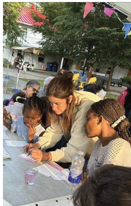
Cet été, Ressource Espace Familles invite les familles, les enfants et les citoyens de tous âges à profiter d'une programmation estivale gratuite, dynamique et inclusive au cœur de la communauté.

Pour découvrir l'ensemble de la programmation estivale et les détails des activités, consultez le www.ressourcespacefamilles.com . ●