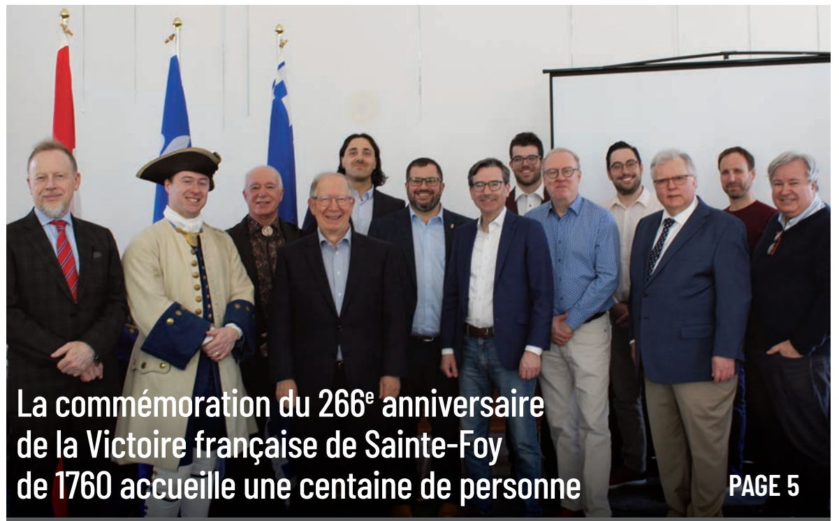
La commémoration du 266 e anniversaire de la Victoire française de Sainte-Foy de 1760 accueille une centaine de personne PAGE 5